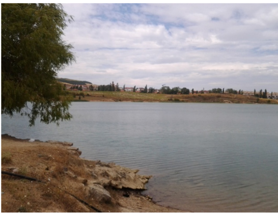
Vista del litoral.