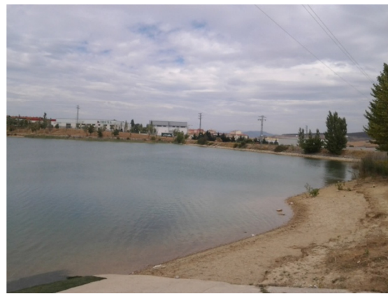
Vista del litoral con el polígono industrial al fondo.