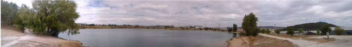
Panorámica de la laguna.